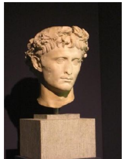
Augustus mit Eichenkranz der „Corona Civica“ (Krone der Bürger)

Es begann bei der Gründung Roms durch Romulus und Remus. Wir sahen eine Büste von Caesar, welche kurz vor seinem Tod entstand. Dann erfuhren wir, dass Augustus Caesars Neffe und später sein Adoptivsohn war, welcher dann „primus inter pares“ also Erster unter gleichen wurde. Das heißt er wollte kein Diktator sein, sondern untergeordnet gegenüber den republikanischen Institutionen bleiben.